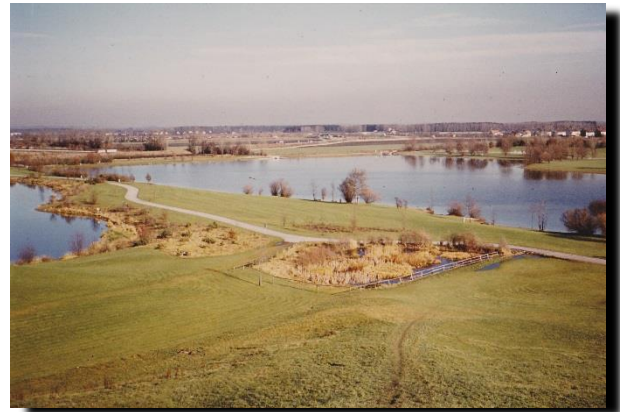
Karlsfelder See 1981

Neben der notwendigen, über einen längeren Zeitraum laufenden Sanierung älterer Erholungsgebiete stehen auch verschiedene Neubauprojekte und Erweiterungen bestehender Anlagen auf der Agenda des Vereins: