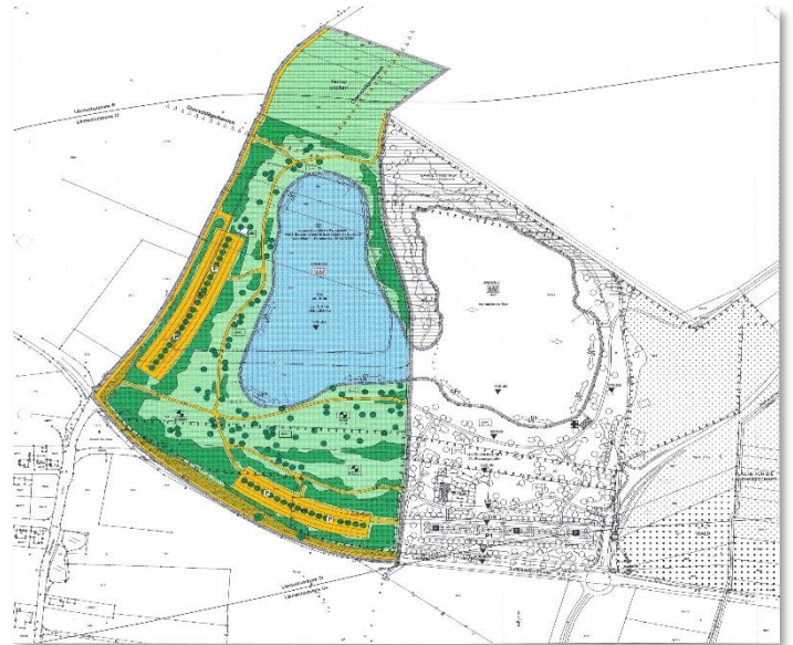
Pucher See - Bebauungsplan 2. Bauabschnitt

Am Olchinger See werden wir die Sanierung des Wegenetzes um den See weiterführen.